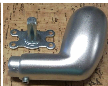
F1 900 a čtyřhran P5