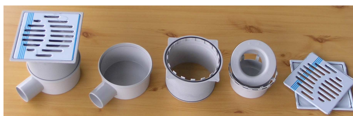
1343IP |-----1343IT - rozebraná-----|